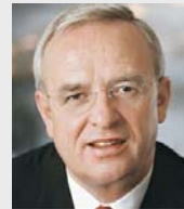
Prof. Dr. Martin Winterkorn Vorsitzender des Vorstandes Volkswagen AG