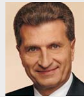
Günther H. Oettinger Ministerpräsident Baden-Württemberg